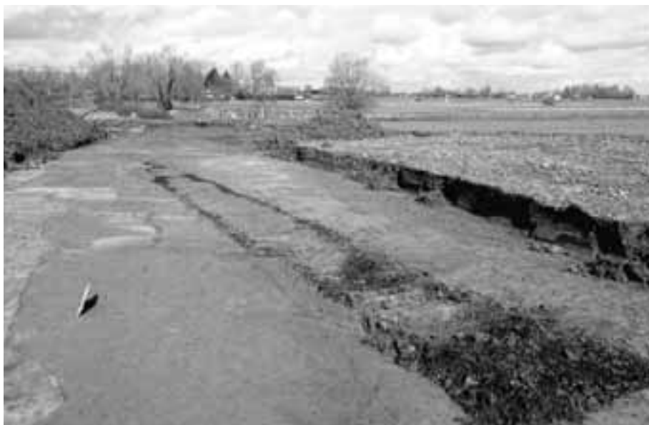
Fig. 17. Moen, Processieweg, opgraving BAAC. Puingroeve, mogelijks van de 18 e eeuw, of resten van een droogloods.