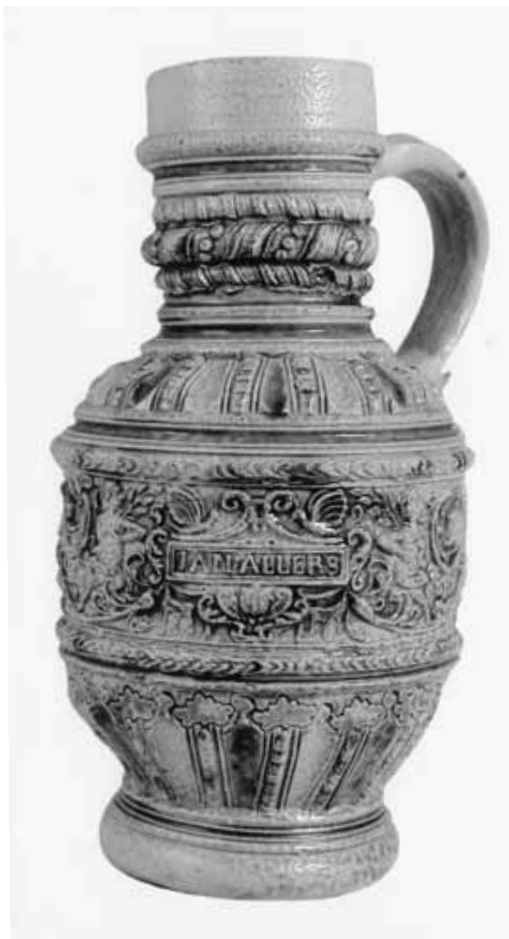
Fig. 14. Steengoedkruik uit Raeren of het Westerwald, ca. 1600 (Museum Commanderie St. Jan, Nijmegen).