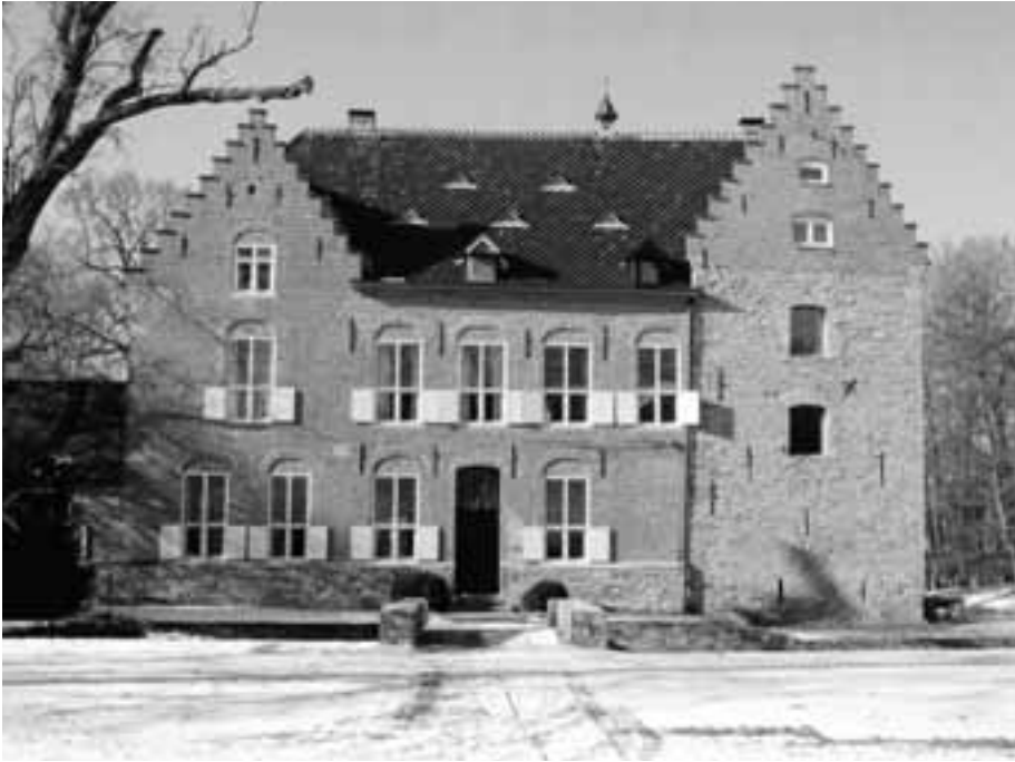
Fig. 22. Pottes, Le Manoir du Quesnoy , waar in het kader van recente restauratie en historisch onderzoek een twaalfde-eeuwse donjon (rechts) tevoorschijn kwam. Met dank aan fam. Ockier.