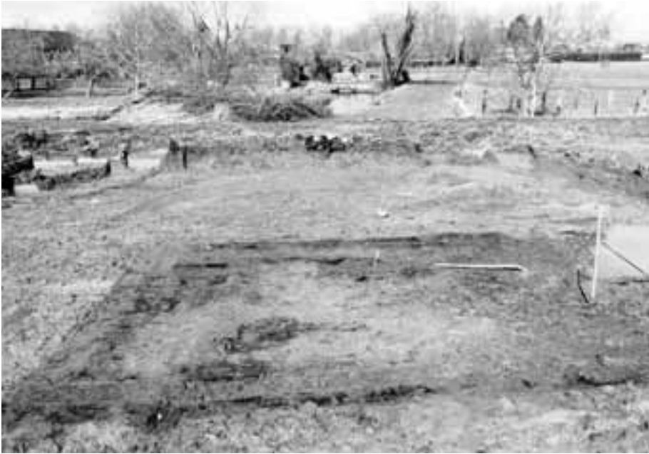
Fig. 16. Moen, Processieweg, opgraving BAAC o.l.v. Tina Dyselinck. Resten van een veldoven voor de productie van baksteen.