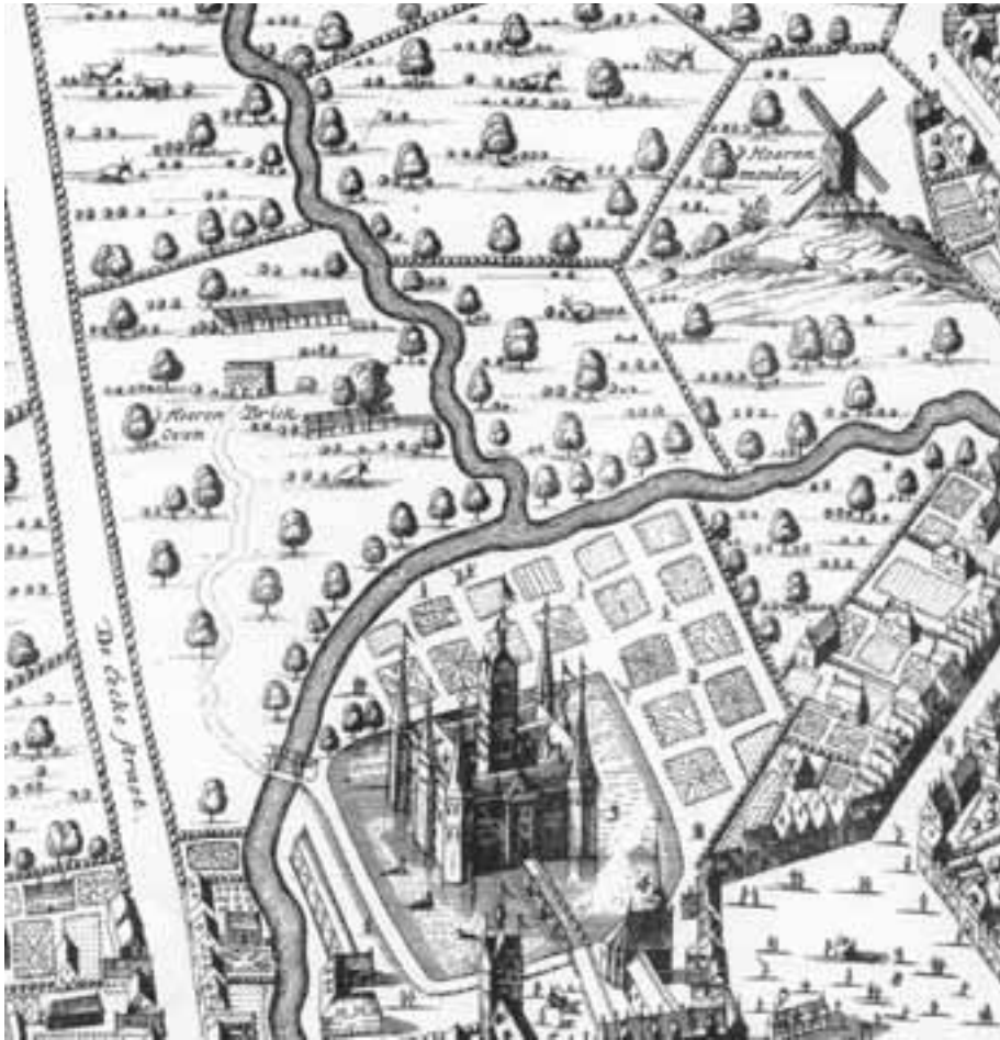
Fig. 18. Steenvoorde (Fr., Nord), steenvoer met droogloodsen, vergelijkbaar met de in Moen opgegraven resten. Afgebeeld in A. Sanderus, Flandria Illustrata , 1641-1644 (heruitgave 1735).