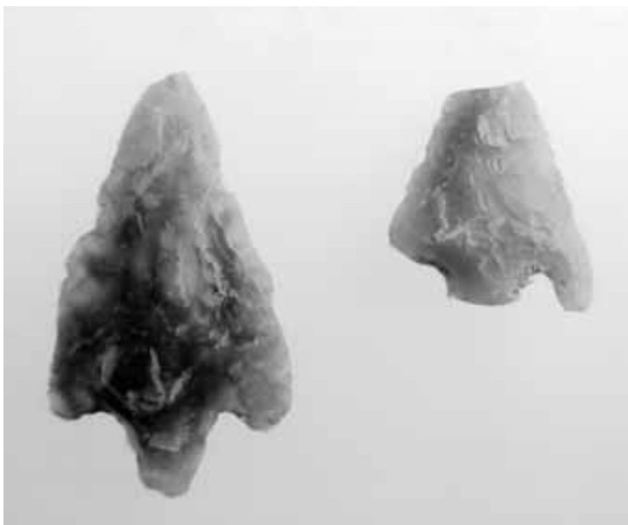
Fig. 3. Heule-Steenakker, prospectievondsten uit 2013 (links) en 2020 (rechts).

Amandscollege, dat nu de plaats ruimt voor een verkaveling. Na opvulling van de vlakdekkende opgraving in 2019 ligt het terrein er nu bezaaid met aardewerk en bouwmaterialen uit de 2 e en 3 e eeuw na Chr., maar verder onderzoek is door de uitbouw van de grootschalige Collegewijk vanaf 1959 niet meer mogelijk.