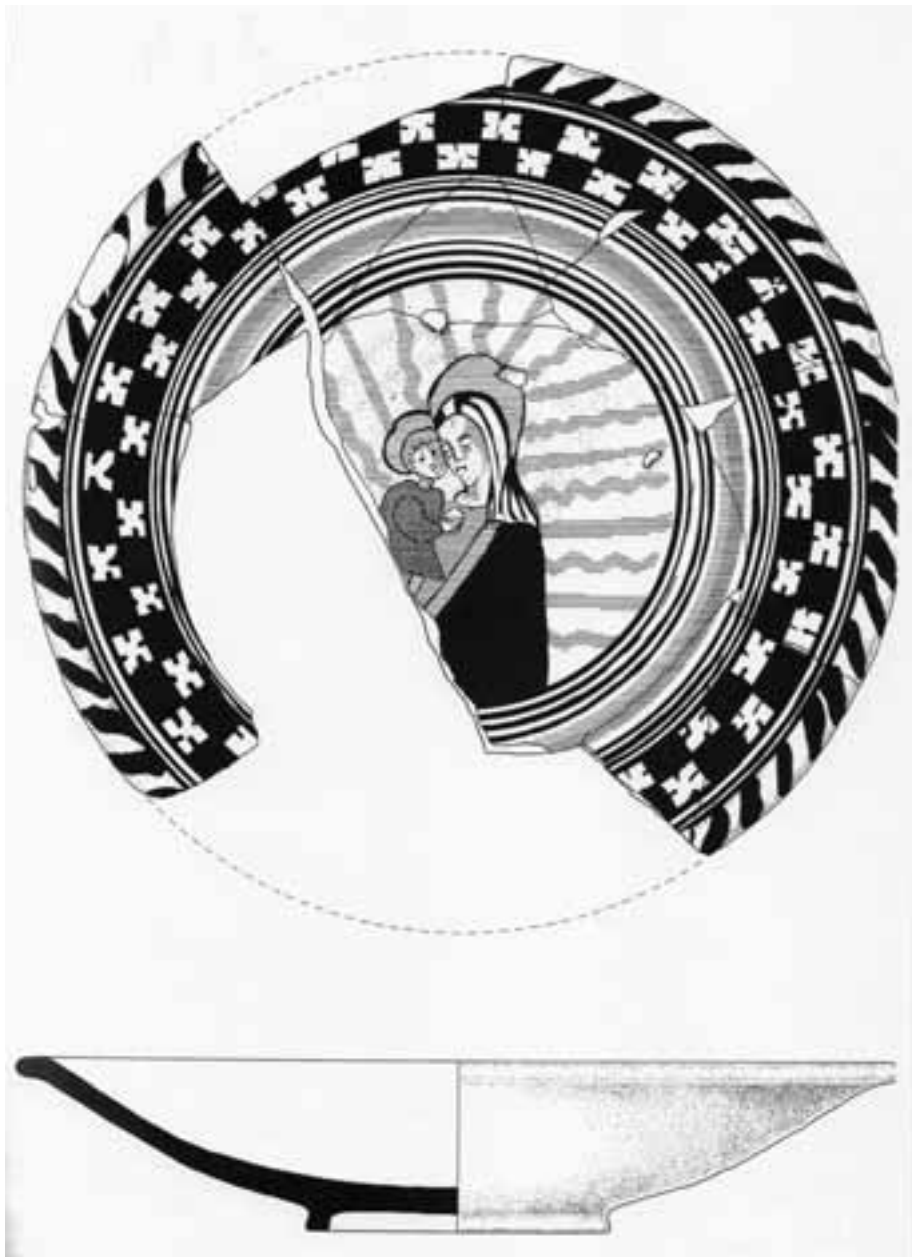
Fig. 4. Kortrijk-Langemeersstraat (vroegere Molenstraat), majolicavondst; schotel van het eind van de 16 e eeuw.