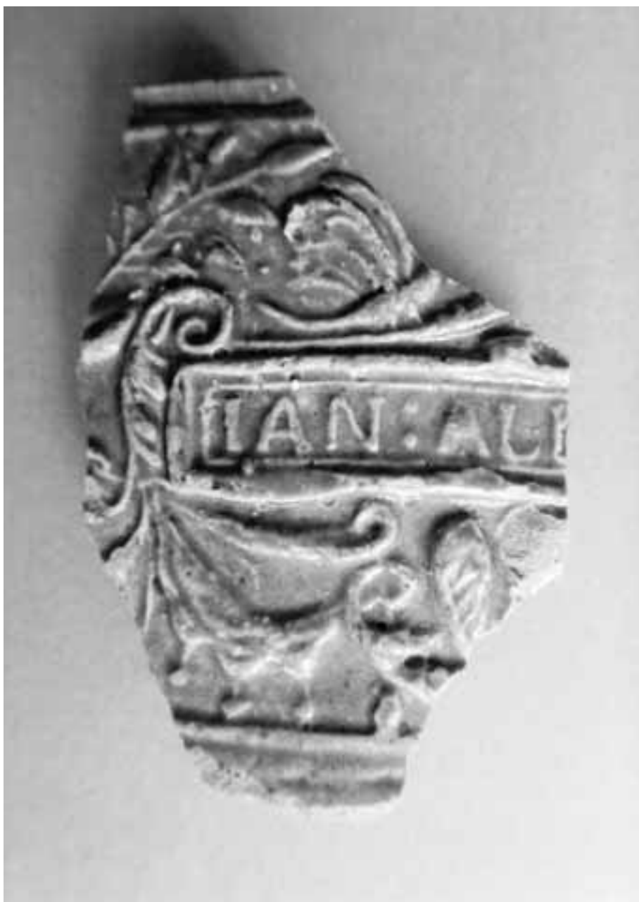
Fig. 15. Identiek kruikfragment uit Menen, vindplaats 83, aangetroffen door Albert Koopman en vervaardigd in Raeren (Oost-België, bij Aachen).