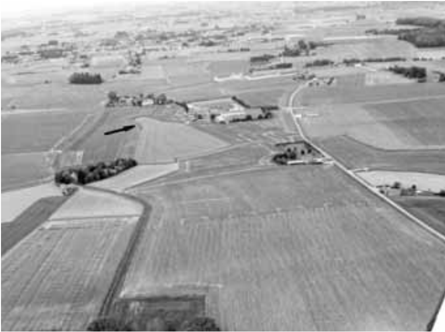
Fig. 13. Sint-Denijs, hetzelfde perceel 491 met opvallend, afwijkende vorm; luchtfoto Ph. Despriet, 10 juni 2020.

met fragmenten van bruinrode daktegels. We vermelden een slijpsteen als landbouwwerktuig en een boterkleurige geweerkei (1670-1830). Bij het ter perse gaan van voorliggend jaaroverzicht vernemen we dat een plan om acht geplande dienstgebouwen, te realiseren op 8 ha grond, intussen afgevoerd is.