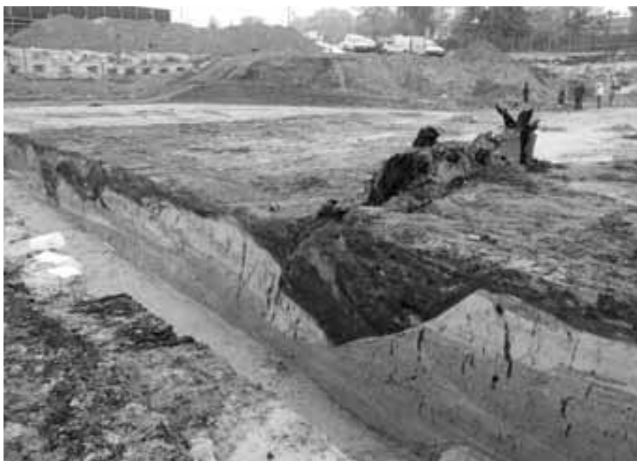
Fig. 7. Kortrijk-Romeinse haven: merkwaardig bodemprofiel van de Romeinse tijd en of de uitbouw van de Franse citadel (1647-1684).