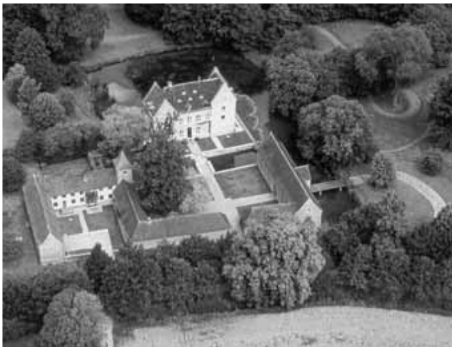
Fig. 21. Luchtfotografie in de Scheldevallei rond Spiere-Helkijn, Hérinnes en Pottes, Le Manoir du Quesnoy; luchtfoto Ph. Despriet, met dank aan burgemeester Dirk Walraet.