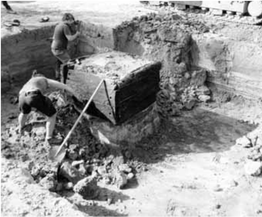
Fig. 5. Kortrijk-Romeinse haven (Liebaertshof): Romeinse waterput tijdens de opgraving.

Scheldestraat-Koolbroekstraat tijdens de 19 e eeuw afgegraven werd voor de aanleg van de weg Sint-Eloois-Vijve naar Kerkhove, waardoor de archeologische laag aangesneden werd en zich nu concentraties van vuursteenvondsten voordoen. De nadruk van de oudste vondsten ligt volgens de nieuwste bevindingen op de grens met Kerkhove, van de Baarmstraat tot aan de grens met Tiegem.