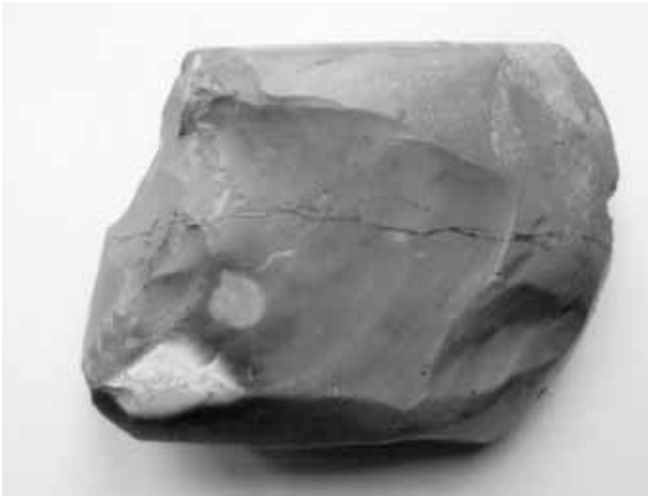
Fig. 20. Sint-Denijs, Beerbosstraat, vindplaats 15: vuurstenen bijl van de Late-Steentijd (rugzijde).

Nieuw zijn de vindplaatsen 132, 139, 146 en 178 waar Romeins aardewerk ingezameld werd. Enkele plaatsen (157 en 166) gaan wellicht nog tot de 13 e eeuw terug en twee waren al bewoond tijdens de 14 e eeuw (169 en 172). Op het nummer 173 vonden we proto-steengoed, een product uit het Rijnland dat in Vlaanderen tijdens de 13 e eeuw op de markt kwam.