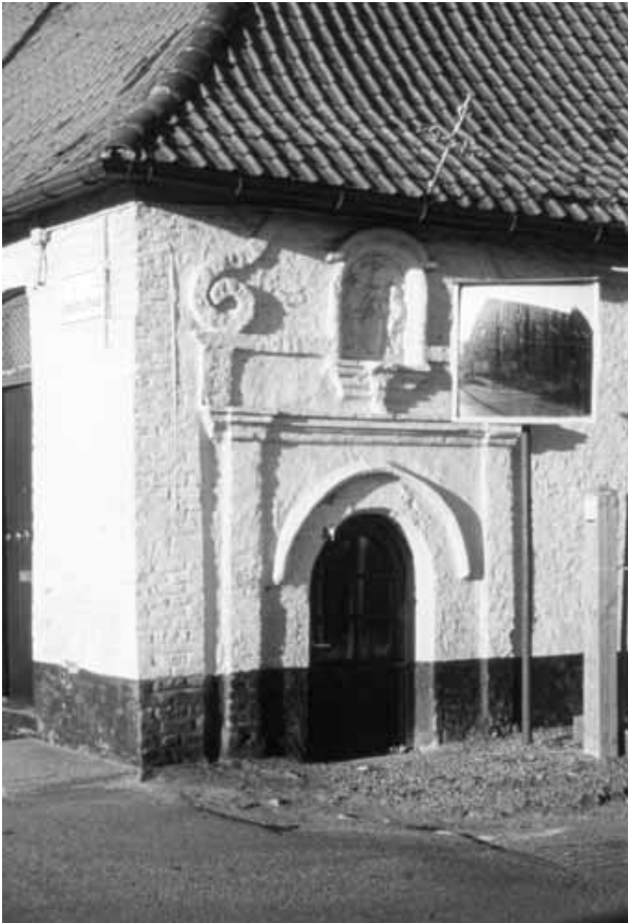
Fig. 2. De Klijttekapel op de grens van Bellegem, Sint-Denijs en Zwevegem gaat terug tot de 17 e eeuw, maar is nu door nieuwbouw bedreigd.