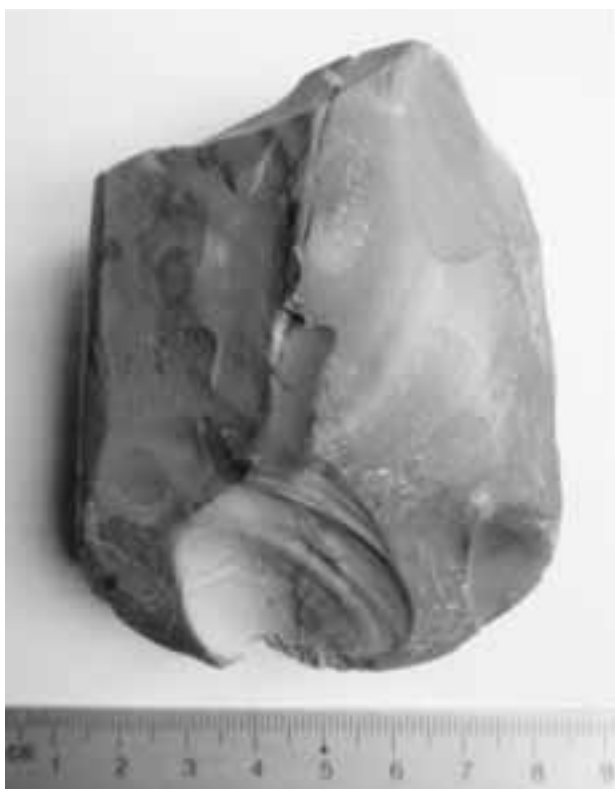
Fig. 19. Sint-Denijs, Beerbosstraat, vindplaats 15: vuurstenen bijl van de Late-Steentijd (voorzijde).