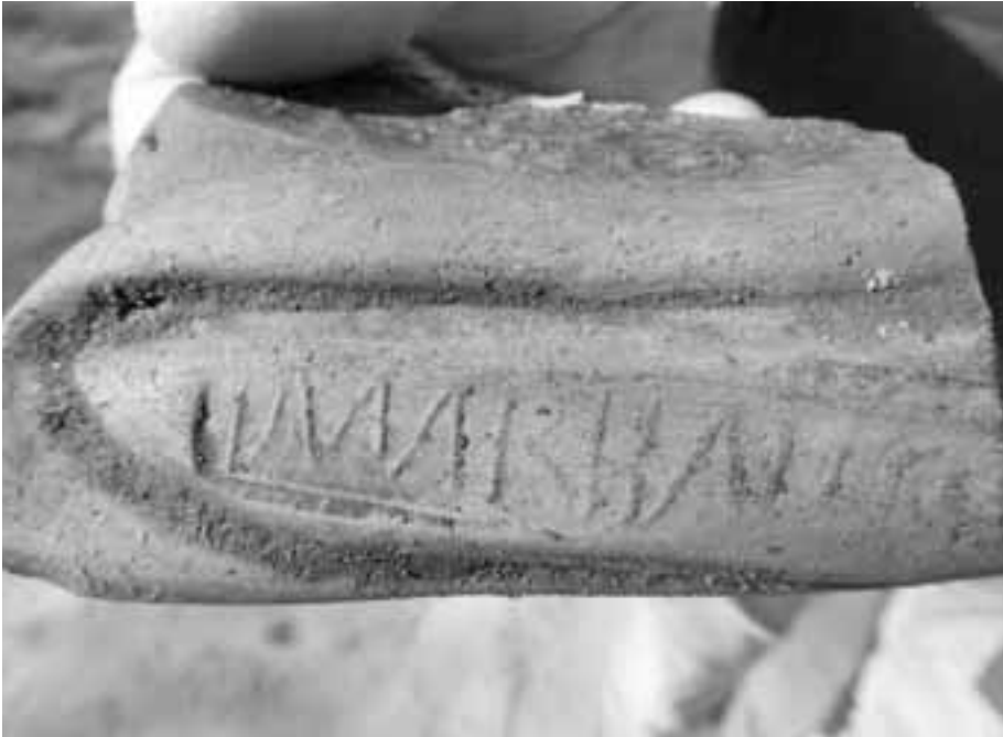
Fig. 8. Kortrijk-Romeinse haven. Mortariumstempel van MARTIALIS, reeds bekend van 17 vindplaatsen in midden-België en enkele rond Bavai, Famars en Pont-sur-Sambre.

aan Monument Vandekerckhove nv; opgestart op 16-18 maart 2020 kon men na een onderbreking door COVID-19 het werk tot een goed einde brengen op 20 april tot 4 mei 2020.