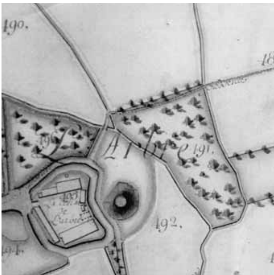
Fig. 12. Onmisbaar voor de studie van het archeologisch patrimonium: de landboeken. Afgebeeld is La Cense de l'Arbre, in het Doornikse deel van Sint-Denijs, 1783. Perceel 491 bezit een vreemde vorm; in het midden een motte?