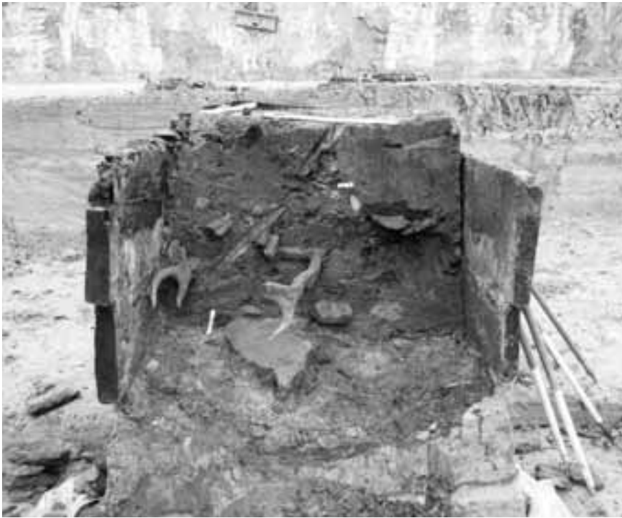
Fig. 6. Kortrijk-Romeinse haven: vulling van dezelfde waterput tijdens de opgraving.

het opschrift République Française. Een muntstuk van 1857 draagt het borstbeeld van Napoléon III (1852-1870). Drie Belgische munten van 1870 en 1874 dateren van de regeringsperiode van Leopold II, koning der Belgen (1865-1909). Een zilveren 50 centiem dateert van 1866.